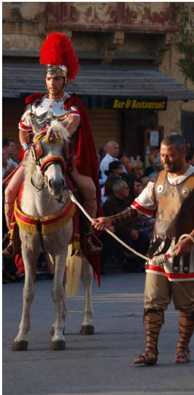
Good Friday Procession Main Streets of Xagħra