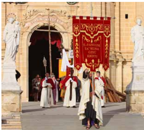
Good Friday Procession Main Streets of Xagħra